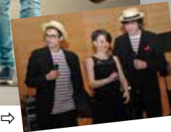
Zweikanalton ↑ Young Voices ⇨