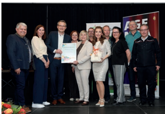
Mit Unterstützung von Land und Europäischer Union